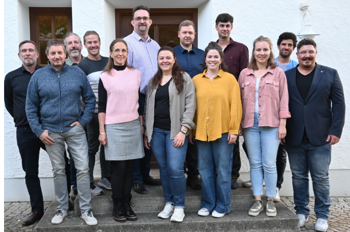
Der neue Gemeinderat